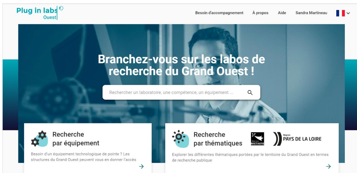
Page d'accueil de la nouvelle plateforme web Plug in labs Ouest www.pluginlabs-ouest.fr

La nouvelle version du portail, déployée ce lundi 1er mars, apporte deux avancées majeures : un moteur de recherche sémantique , qui délivre une pertinence accrue dans les résultats de recherche de mots-clés, ainsi qu'une meilleure prise en charge des contacts entrants , afin de garantir aux laboratoires et plates-formes référencés une visibilité plus fine de l'activité de Plug in labs Ouest.