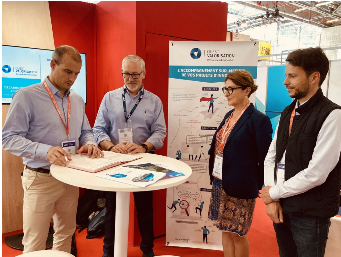
Signature du partenariat entre Absiskey et la SATT Ouest Valorisation